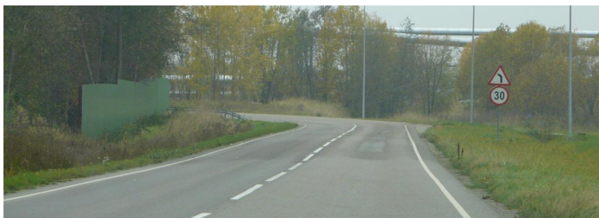
Foto 5. Järsk kurv Nuudi tee alguses