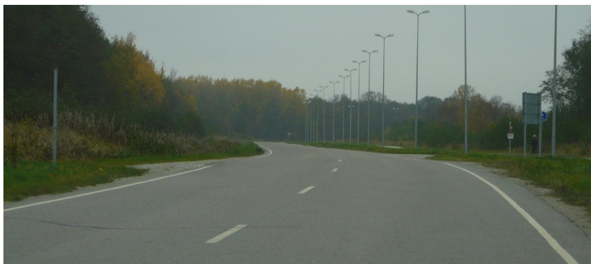
Foto 2. Ebatasasused - põikpraod Nuudi teel