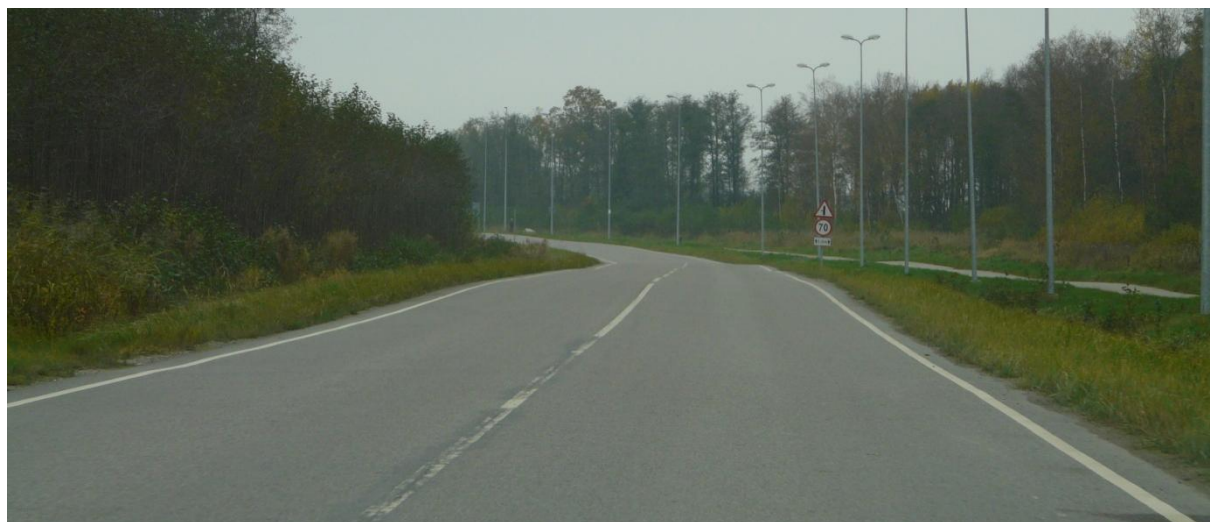
Foto 1. Ebatasasused - külmarkerked Nuudi teel