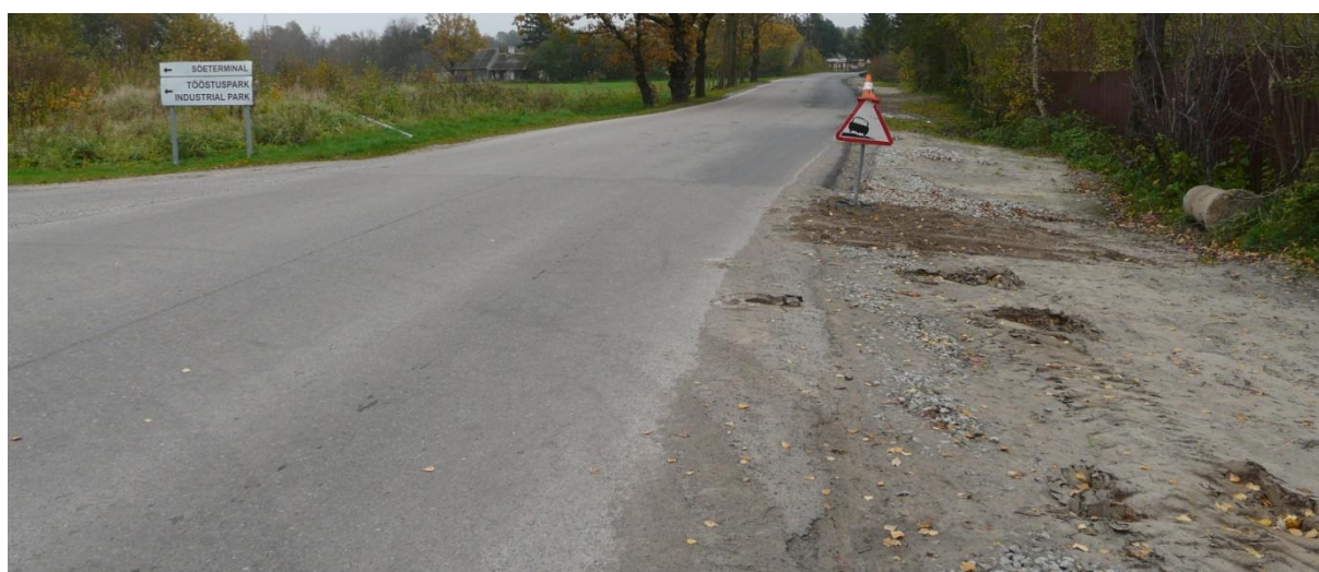
Foto 8. Nuudi-Maardu ristmikule tuleb Maardu suunale välja ehitada uus sõidurada (tagada vasakpöördele ooterada)