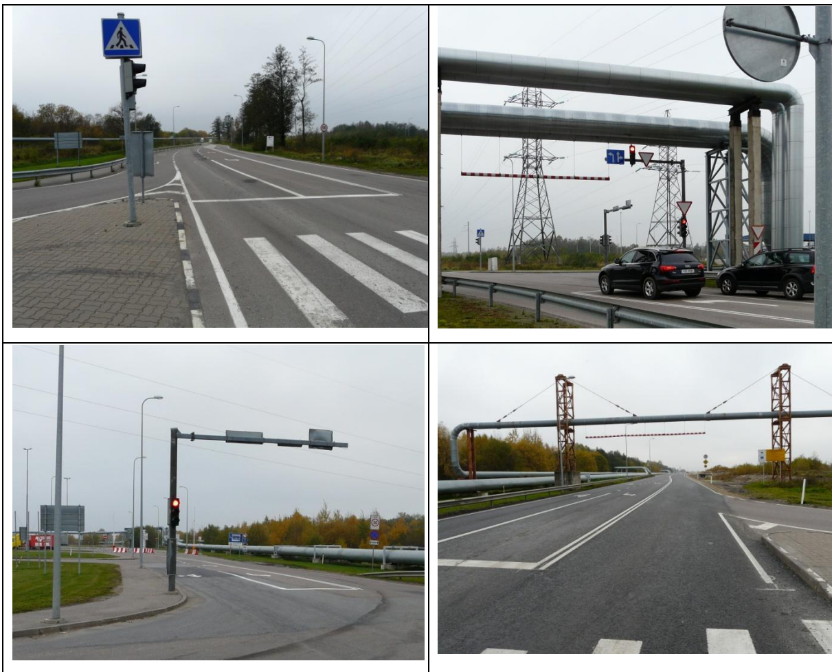
Foto 10. Maardu-T94 ristmik on kõrgis suundades kanaliseeritud foorrismik lisarajaga Tallinnast lõunasuunas