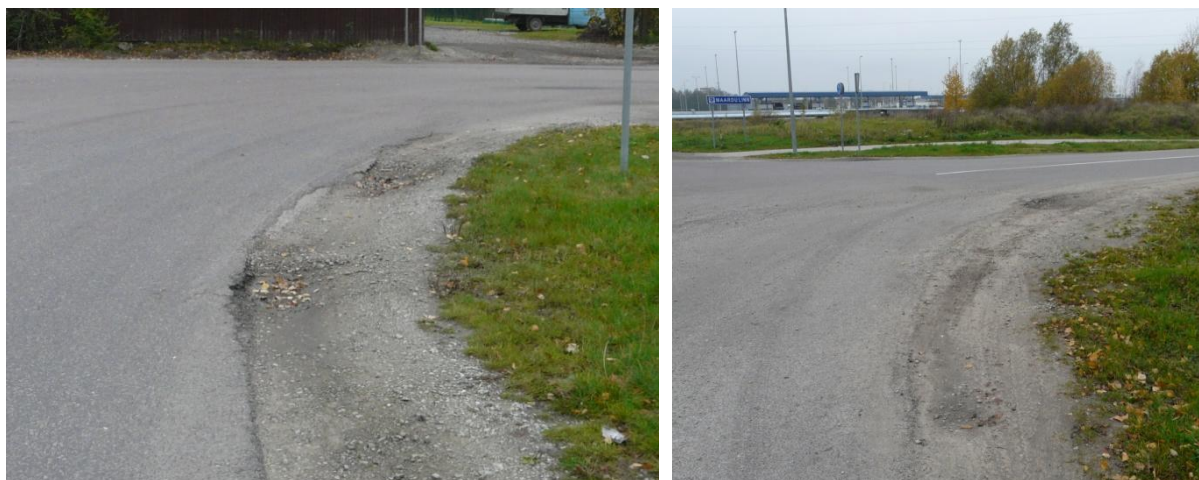
Foto 7. Nuudi-Maardu ristmikul tuleb pöördeala tugevdada mõlema parempöörde jaoks