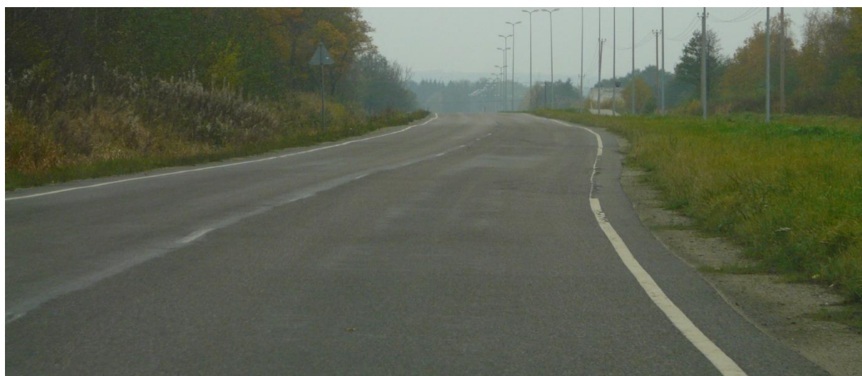
Foto 3. Ebatasasused ja kohatine ülekate Nuudi teel