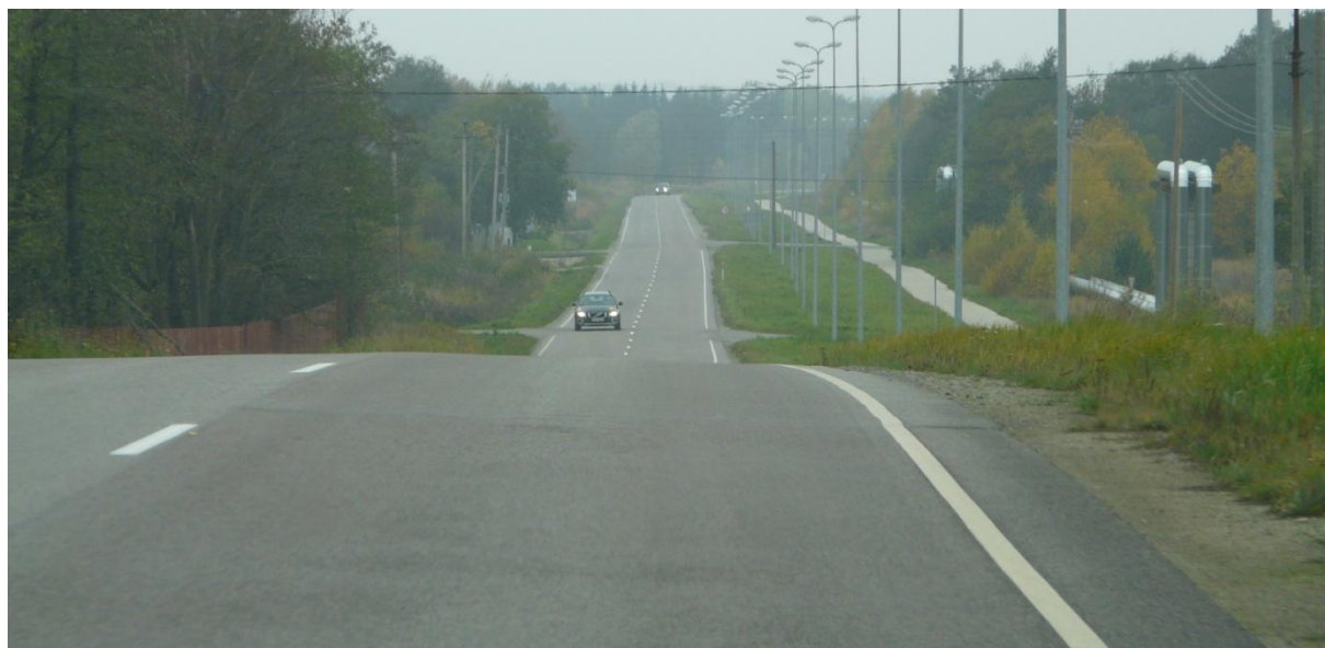
Foto 4. Nuudi tee muutlik pikiprofiil põhjustab mahasõitudel nähtavuse probleeme