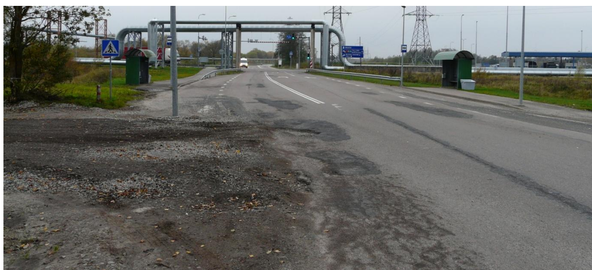
Foto 9. Kandevõime probleemide tõttu vajab Maardu tee idasuunaline sõidusuund aluse remonti