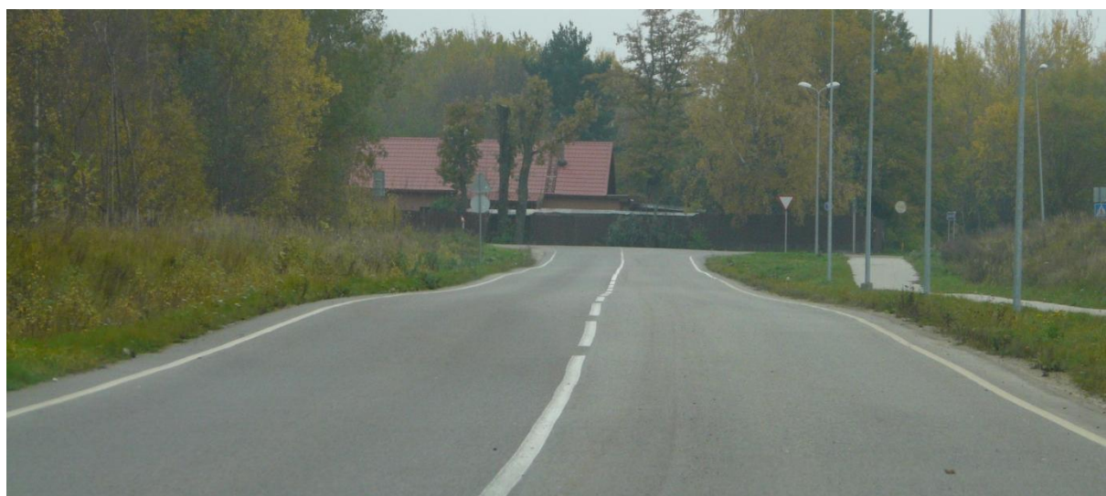
Foto 6. Nuudi tee ristumine Maardu teega